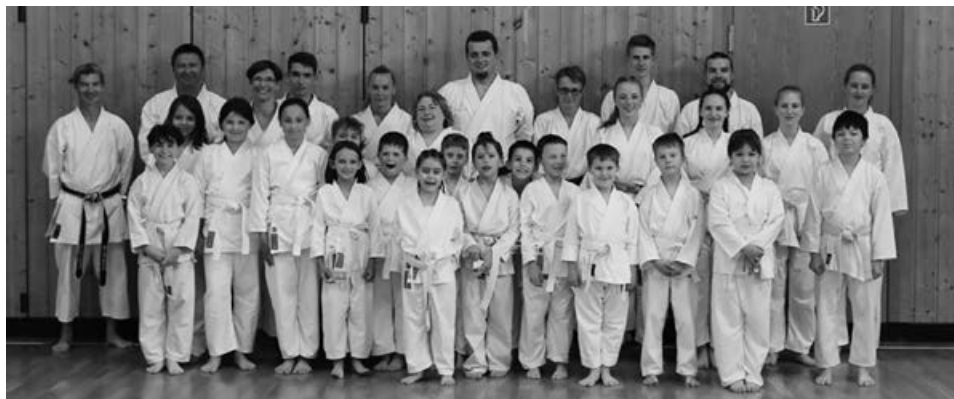
Die erfolgreichen Karate-Prüflinge des TV-Mömlingen

Mit einer Länge von drei Stunden, war das bis jetzt unsere längste Prüfung. Ein Dank an die Zuschauer für deren Ausdauer. Es war toll, die ganze Bandbreite unserer Abteilung in der Halle zu haben und zu sehen, wie wir in den letzten Jahren gewachsen sind. Wir sind eine Gemeinschaft, in der sich Jung und Alt sehr wohl fühlen und auf die wir stolz sind.