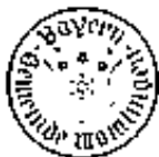
Siegfried Scholtka Erster Bürgermeister