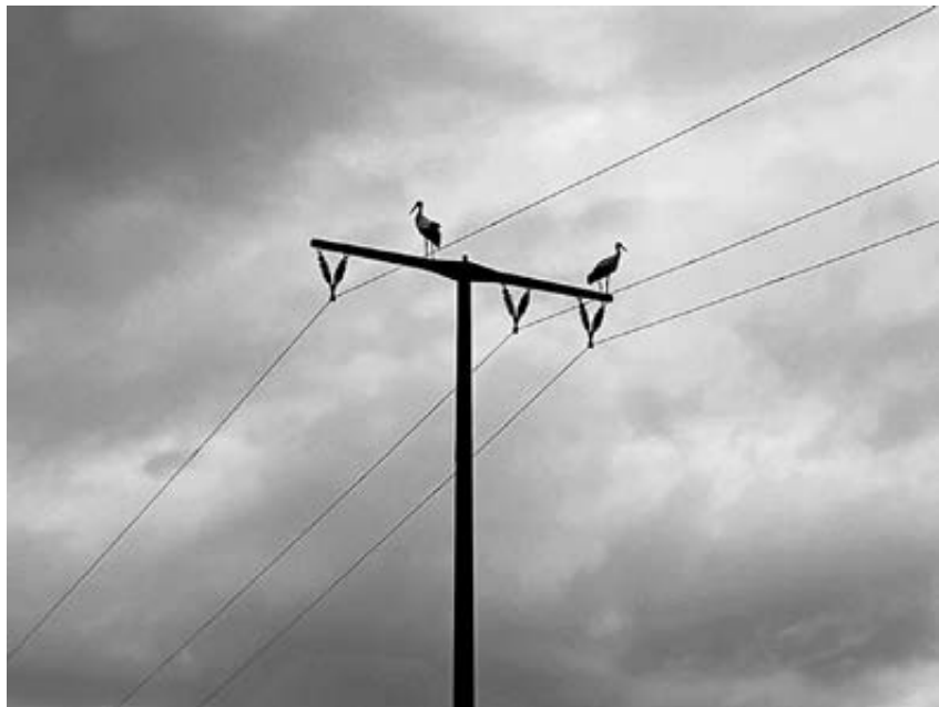
Störche in Mömlingen

Am Abend des 30. Juni wurden in Mömlingen 5 Störche im Bereich des Holzberges gesichtet. Wahrscheinlich handelt es sich um die Storchfamilie aus Obernburg, die Mömlingen einen „Besuch“ abstattete.