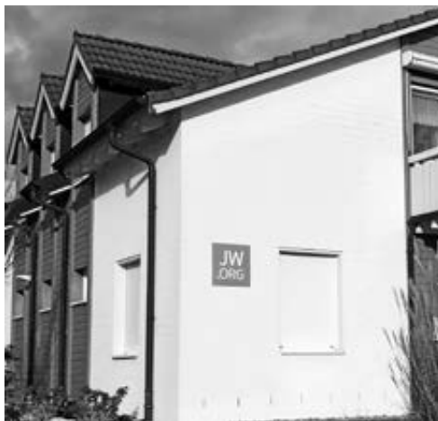
Königreichssaal der Zeugen Jehovas in Schaaafheim

Versammlungsbibelstudium auf Grundlage des Bibelbuches Hesekiel „Verbessertes Verständnis auf einen Blick“