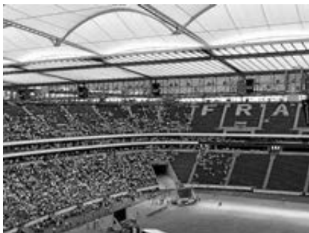
Drei Jahre Geduld haben sich gelohnt: Jehovas Zeugen aus Schaaheim freuen sich auf ihren großen Sommerkongress im Deutsche Bank Park

„Wir laden aber jeden zu den Gottesdiensten an allen drei Tagen herzlich ein.“ Der Eintritt ist frei, es ist keine Anmeldung erforderlich und es findet keine Kollekte statt.