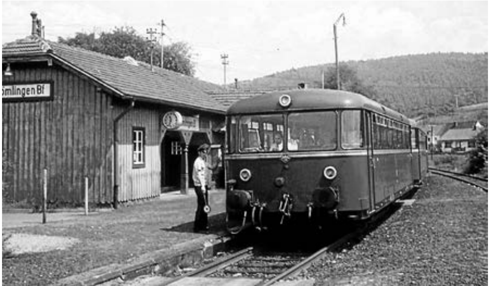
Ein Schienenbus 1973 am Mömlinger Bahnhof

Auf einen unterhaltsamen Mümlinger Owend freut sich Euer Heimat- und Geschichtsverein Mömlingen!