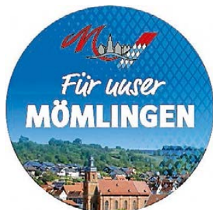
Banner: Für unser Mömlingen

Herzlichen Dank allen Wählerinnen und Wählern für ihre Stimmen bei der Kommunalwahl 2026!