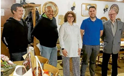
Neue Vorstandschaft des Schützenverein Mömlingen

Am 20. März fand die Jahreshauptversammlung im Schützenverein Mömlingen 1962 e.V. mit Neuwahlen statt.