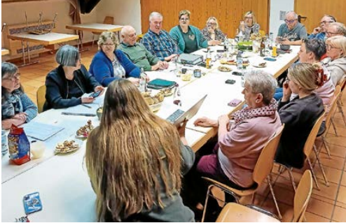
Wahlachlese im Feuerwehrhaus