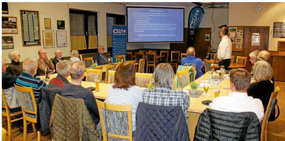
Ortshauptversammlung im Viktoria Sportheim