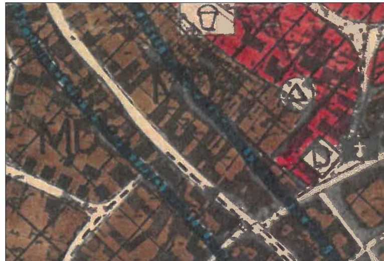
FLÄCHENNUTZUNGSPLAN M. 1 : 2.500 BESTAND