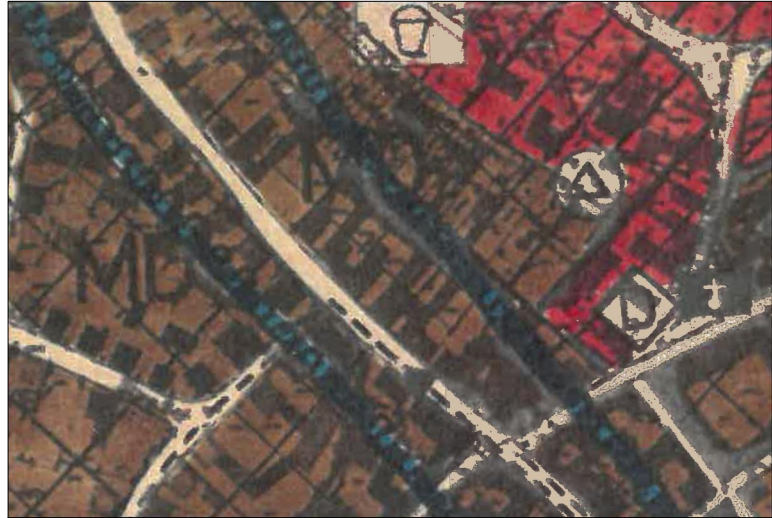
FLÄCHENNUTZUNGSPLAN M. 1 : 2.500 BESTAND

Somit ist der Plan gemäß § 6 Abs. 5 BauGB wirksam geworden. Mömlingen, den ..... (Gemeinde) (Siegel) ..... (Siegfried Scholtka, 1. Bürgermeister)