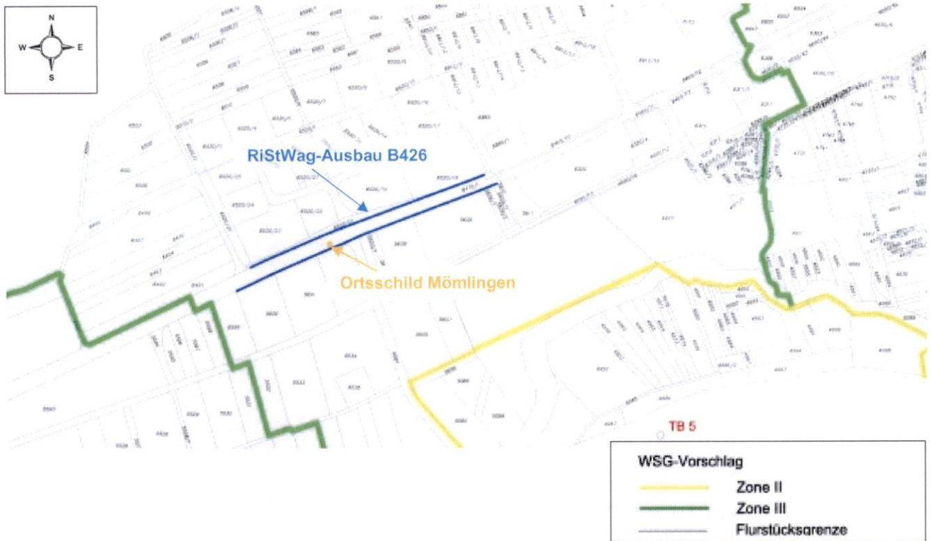
Abbildung 3: Vorgeschlagenes WSG für den Brunnen TB 5 und Kennzeichnung des RiStWag-Ausbaus der Bundesstraße B426 (unmaßstäbliche Darstellung; Flurstücksplan)

umgehendes Abbaggern und Entsorgen von eventuell kontaminiertem Erdreich eine Gefährdung des mehr als 500 m entfernt liegenden Brunnen TB 5 vermieden werden.