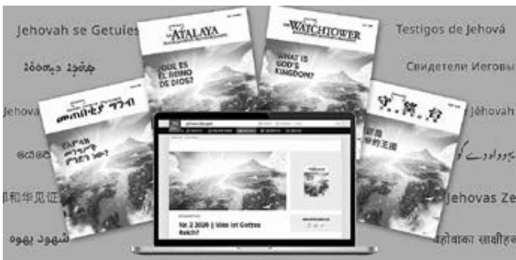
Fotolegende: Gedruckte und elektronische Ausgaben des Wachturms mit dem Titel „Was ist Gottes Reich“ werden im September im Rahmen einer weltweiten Aktion verteilt

Im September verbreiten Zeugen Jehovas weltweit eine besondere Ausgabe ihrer Zeitschrift Der Wachturm mit dem Titel: „Was ist Gottes Reich?“ Die Zeitschrift kann auf JW.ORG gratis in über 780 Sprachen heruntergeladen werden. Alternativ kann man eine gedruckte Ausgabe bei einem Zeugen Jehovas vor Ort an der Haustüre oder in der Innenstadt erhalten.