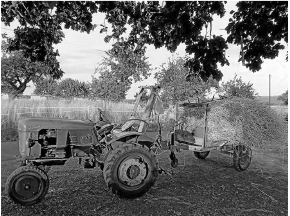
Von Hand geerntet. Das Korn ist eingefahren und wartet darauf, gedroschen zu werden.

Über jede zupackende Hand freuen wir uns. Wenn wir gut zusammen helfen, sollte alles recht schnell erledigt sein.